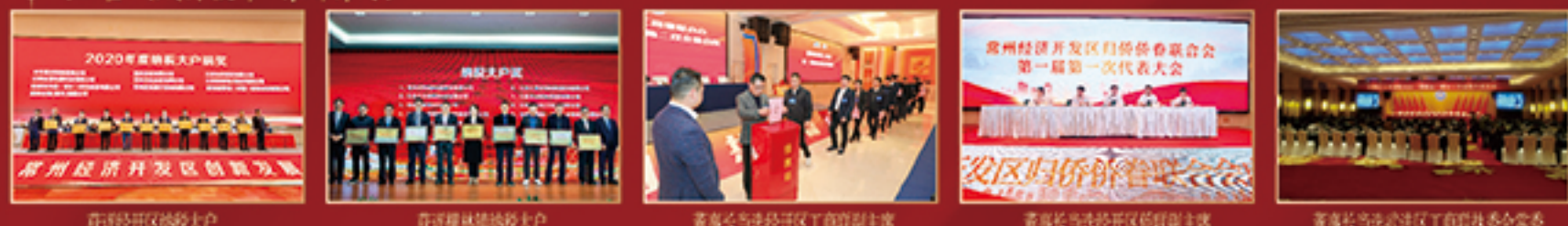
获评经开区纳税大户