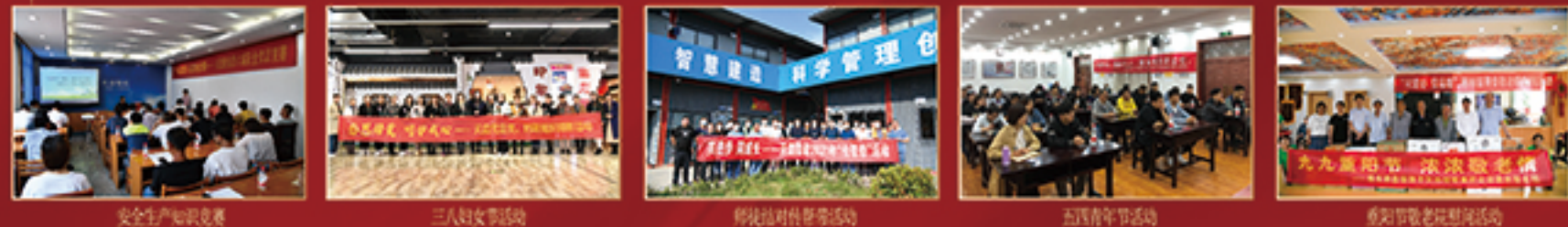
安全生产知识竞赛