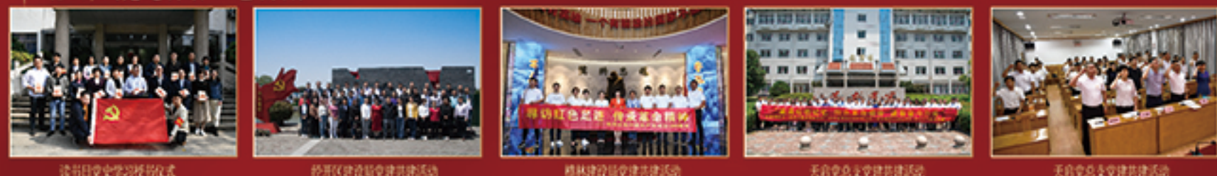
读书日党史学习授书仪式