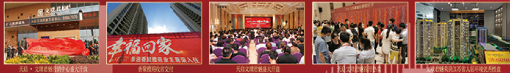
天启·文璟府营销中心盛大开放