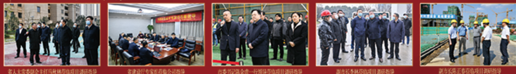
省人大常委副主任马秋林莅临项目调研指导